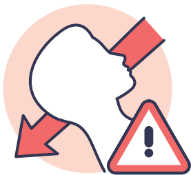
PERTE DE CONSCIENCE