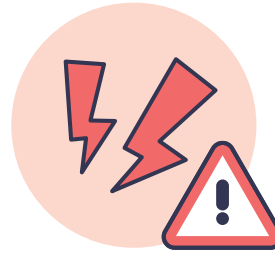
DOULEUR SOUDAINE DANS LE BAS DU DOS, LE VENTRE OU LES JAMBES

Les bulletins d'information Erreurmed sont examinés par des consommateurs qui s'engagent à améliorer la sécurité des médicaments. Les enseignements tirés des déclarations des consommateurs sont partagés avec les professionnels de la santé grâce aux publications de l'ISMP Canada. Ce bulletin contient de l'information sur l'utilisation sécuritaire des médicaments. À vocation non commerciale, le bulletin n'est pas assujéti à la Loi canadienne anti-pourriel. * Le soutien financier a été fourni par Santé Canada. Les opinions exprimées dans ce document ne sont pas nécessairement celles de Santé Canada. Erreurmed est un élément du système canadien de déclaration et de prévention des incidents médicamenteux (SCDPIM) .