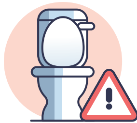
GRAVES VOMISSEMENTS ET DIARRHÉE